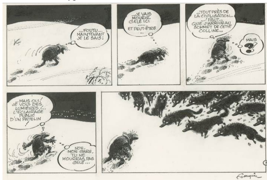
Franquin, Idées noires, L'homme et les loups © Franquin, Fluide glacial