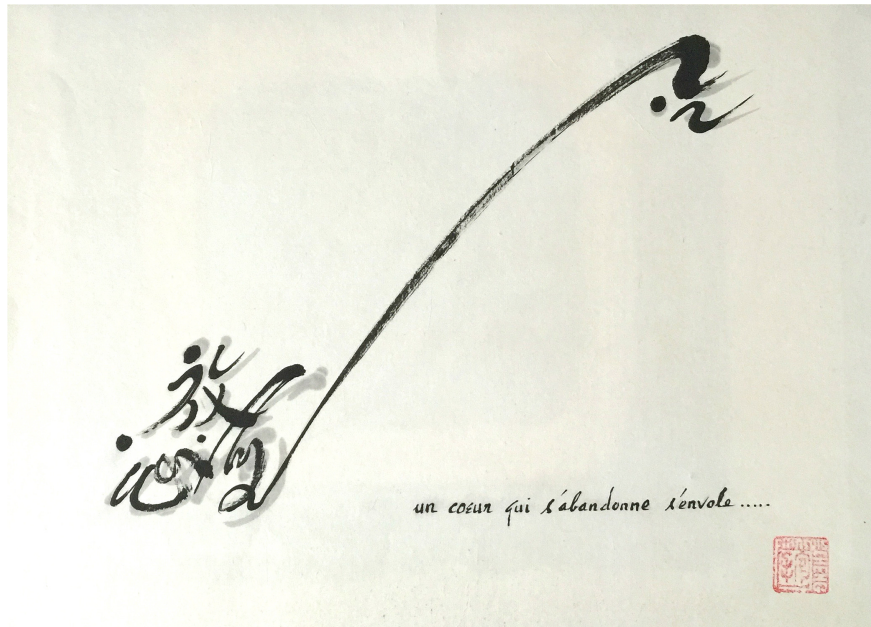
François Cheng, Un cœur qui s'abandonne s'envole, calligraphie

FRANCOIS CHENG, de l'Académie Française, Parrain de l'édition 2018